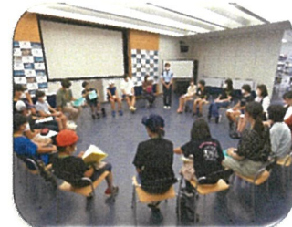
(しまね海洋館アクアス)