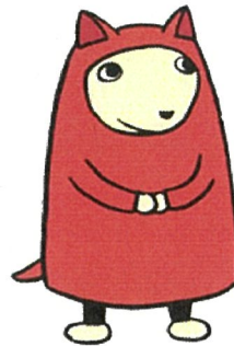
介護相談員キャラクター クーちゃん